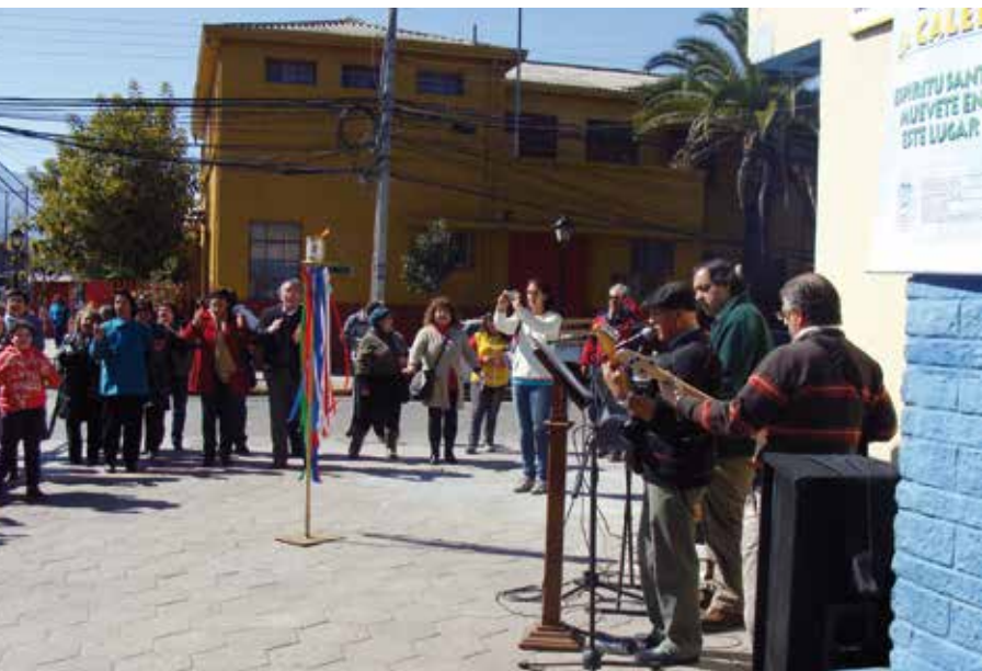
En el litoral central.

El domingo 19 de agosto tanto los hermanos de San Felipe como de Los Andes salieron juntos para pasar la antorcha a la RCC de Cabildo.