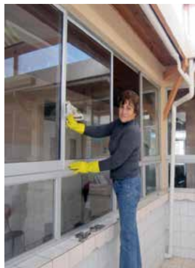
Hogar Don Orione en Antofagasta.

Misa de Acción de Gracias. Esta celebración se hizo en la parroquia Salar del Carmen, y fue el momento de agradecer a Dios por todas