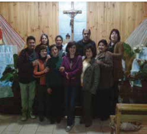
En Victoria con hermanos de Traiguén y comunidad campesina.