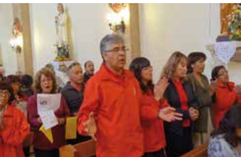
En el norte grande.