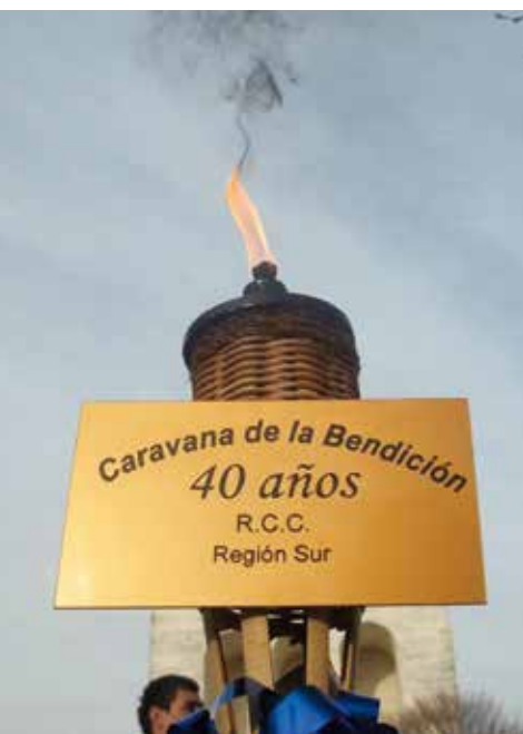
La Antorche en Osorno.

tuó una proclama pública en la plaza de Puerto Montt. Comenzó con un esquinazo folklórico a la Virgen del Carmen, lo que sirvió para dar inicio al mes de la patria y para orar por Chile.