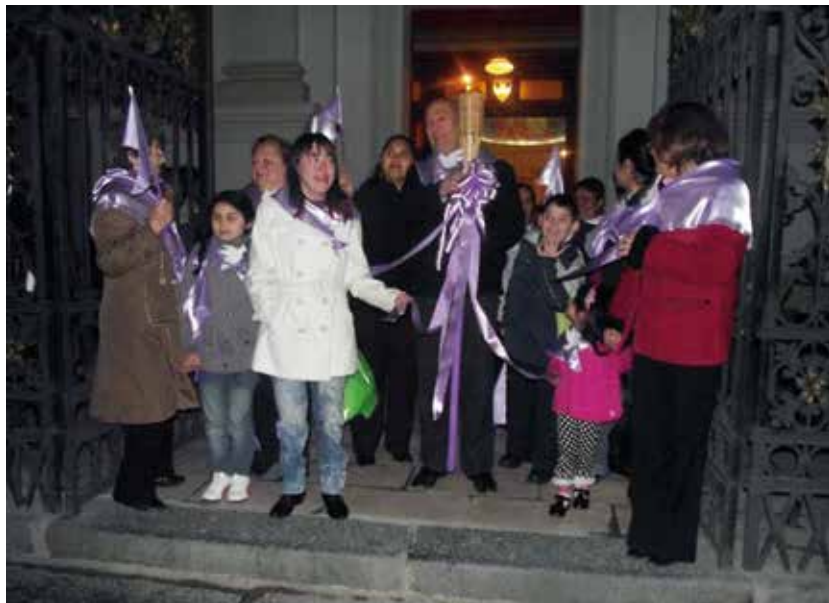
En Punta Arenas.

Pese a no llegar la antorcha físicamente por razones geográficas sí se hizo un signo de bendición: el párroco de la ciudad, encendió el cirio y realizó un envío a los presentes para proclamar con fuerza