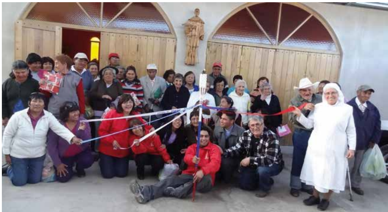
En el norte grande.