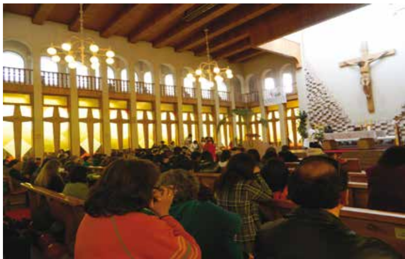
Eucaristía en Templo Catedral en Temuco.