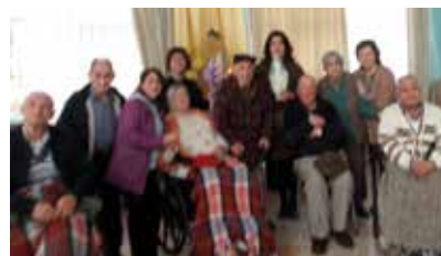
La Antorcha visita Hogar de Ancianos en Puerto Montt.

Algunas de las actividades realizadas durante el paso de la Antorcha de la Bendición por la Arquidiócesis de Puerto Montt.