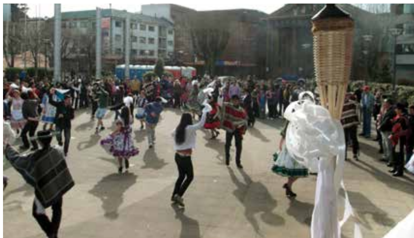
Esquinazo a la Virgen junto a la Antorcha en la plaza de Puerto Montt.