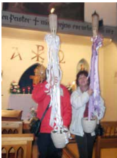
Llegada de la Antorcha a Puerto Montt.

Algunas de las actividades realizadas durante el paso de la Antorcha de la Bendición por la Arquidiócesis de Puerto Montt.